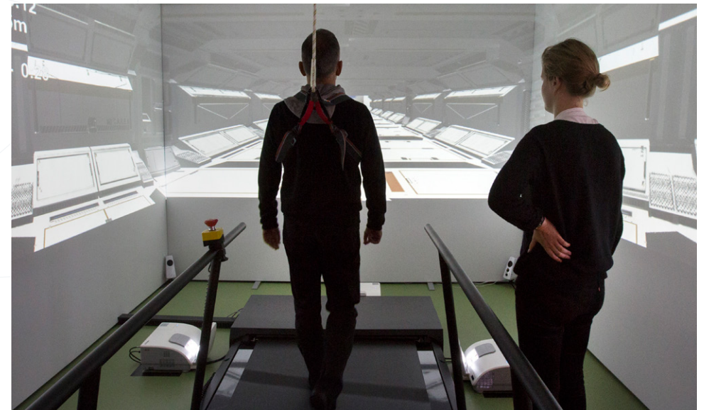
Tijdens de therapie loopt de patiënt op een loopband door een virtuele omgeving

Het verschil met EMDR is dat bij 3MDR visuele, auditieve en fysieke elementen zijn toegepast. Het imaginaire beeld van EMDR is vervangen door levensgrote foto's die in een 180-graden gezichtsveld worden getoond. Bovendien wordt er muziek toegevoegd. Tijdens de sessie loopt de patiënt op een loopband, waarbij hij ongeveer 2,5 km aflegt.